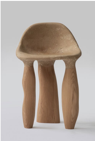
NOT WASTED , stool W 42 x D 44 x H 64 cm W : 9 kg Wood : Oak and Agglomera Finish : oil