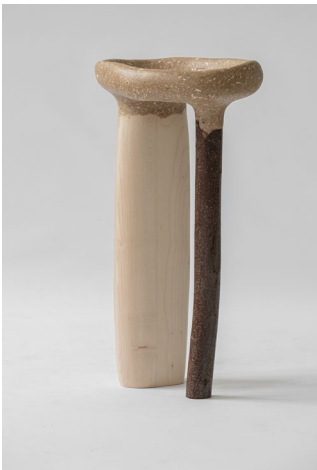
NOT WASTED , side table W 32 x D 25 x H 56 cm W : 4 kg Wood : sycamore Finish : Oil