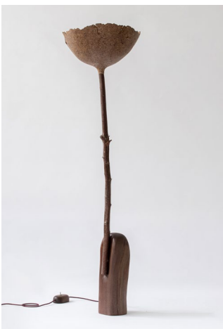
I'M NOT WASTED , side table D 52 x H 182 cm W : 8 kg Wood : Walnut Finish : Oil Price (HT): 4900 €